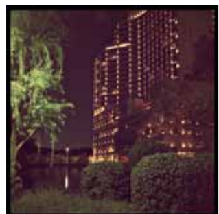
夜晚的酒店與WADAKURA公園