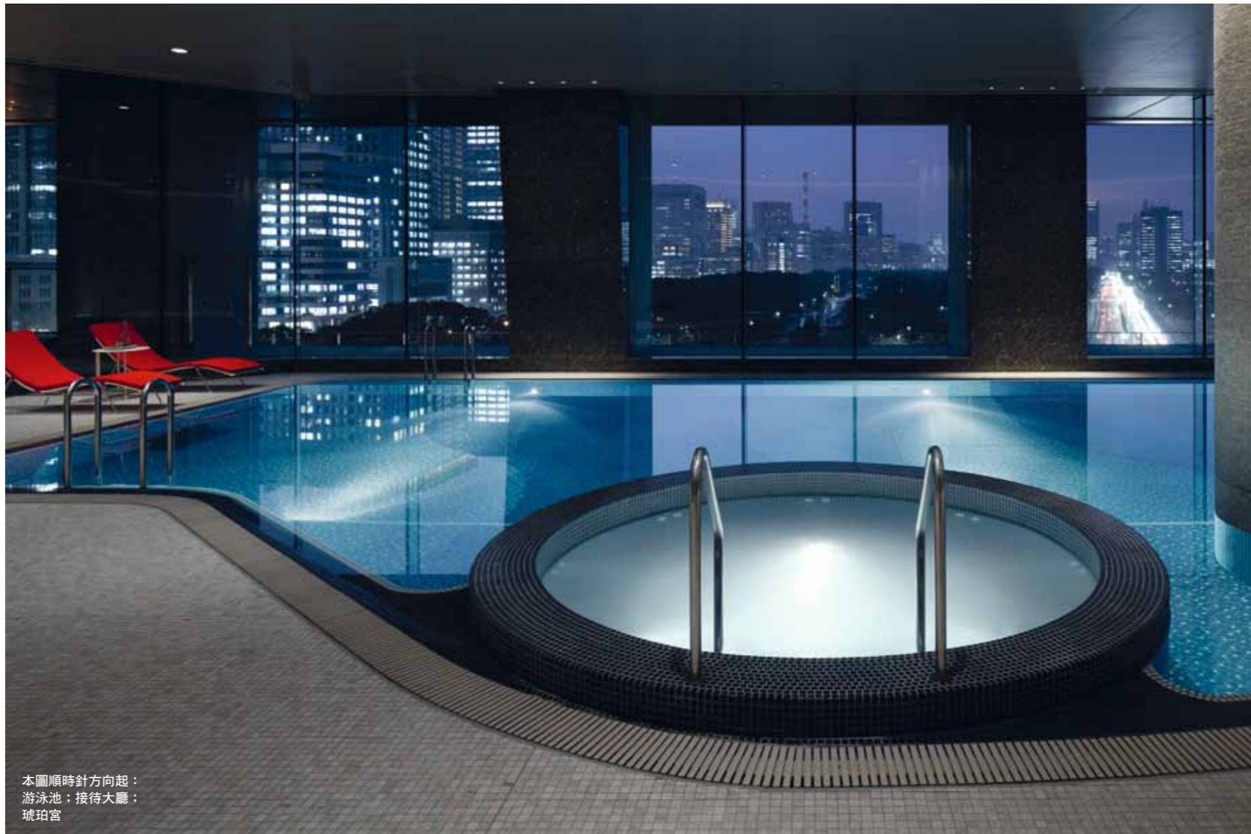
本圖順時針方向起： 游泳池；接待大廳； 琥珀宮