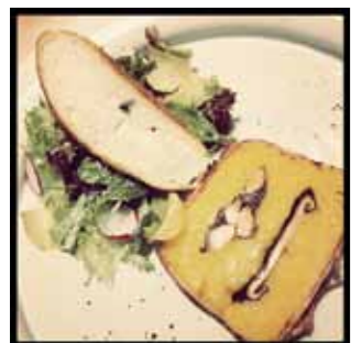
更多來自WADAKURA餐廳裡GO的美味料理