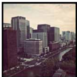
從休憩廳看出去的城市