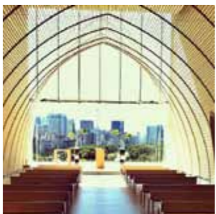
誰都想在這美輪美奐的教堂裡完成終身大事