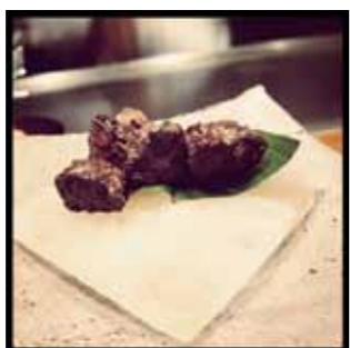
WADAKURA餐廳裡的沙朗牛排