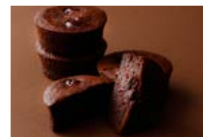
Gâteau au Chocolat et Griottes ガトーショコラグリオット