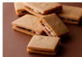
Raisin & Cranberry Sandwiches レーズン&クランベリーウィッチ