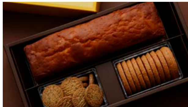
Charmant A シャルマン A

ガレット プルトン 1 サブレ ベルガモット 1 マドレーヌ シトロン 3 フィンランシェ 3